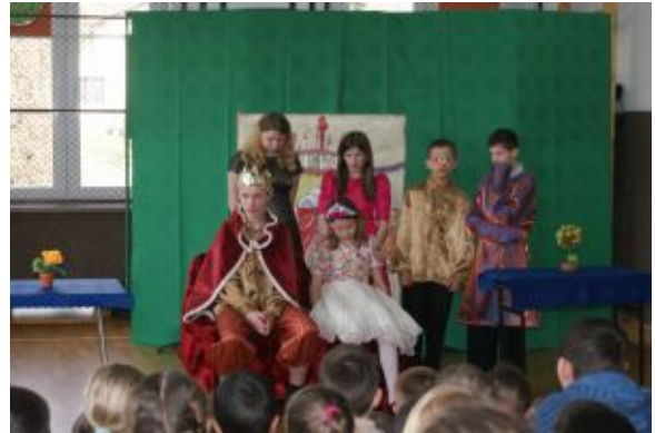
Występ młodych artystów

24 marca gościliśmy w naszej szkole uczniów ze Szkolnego Ośrodka Opiekuńczo – Wychowawczego z Frysztaka. Zaprezentowali oni trwającą 45 minut sztukę teatralną pt. Zaczarowane trzewiczki . Młodzi aktorzy wykazali się wielkim profesjonalizmem. Z ogromną swobodą wcielili się w role i pokazali, że w życiu można sprawić radość innym nawet najmniejszymi drobiazgami. Podziwiamy ich wielkie zaangażowanie i chęć zaprezentowania swoich umiejętności teatralnych. Po spektaklu, który wzbudził wielkie zainteresowanie, przyszedł czas na poczęstunek i integrację z naszymi uczniami.