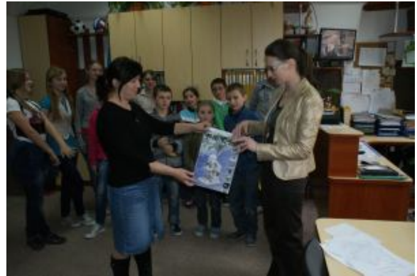
Chwile oczekiwania na...

Zachęcamy wszystkich do dalszej zabawy! Tym razem wyłonimy dwóch zwycięzców! Nagrody czekają!