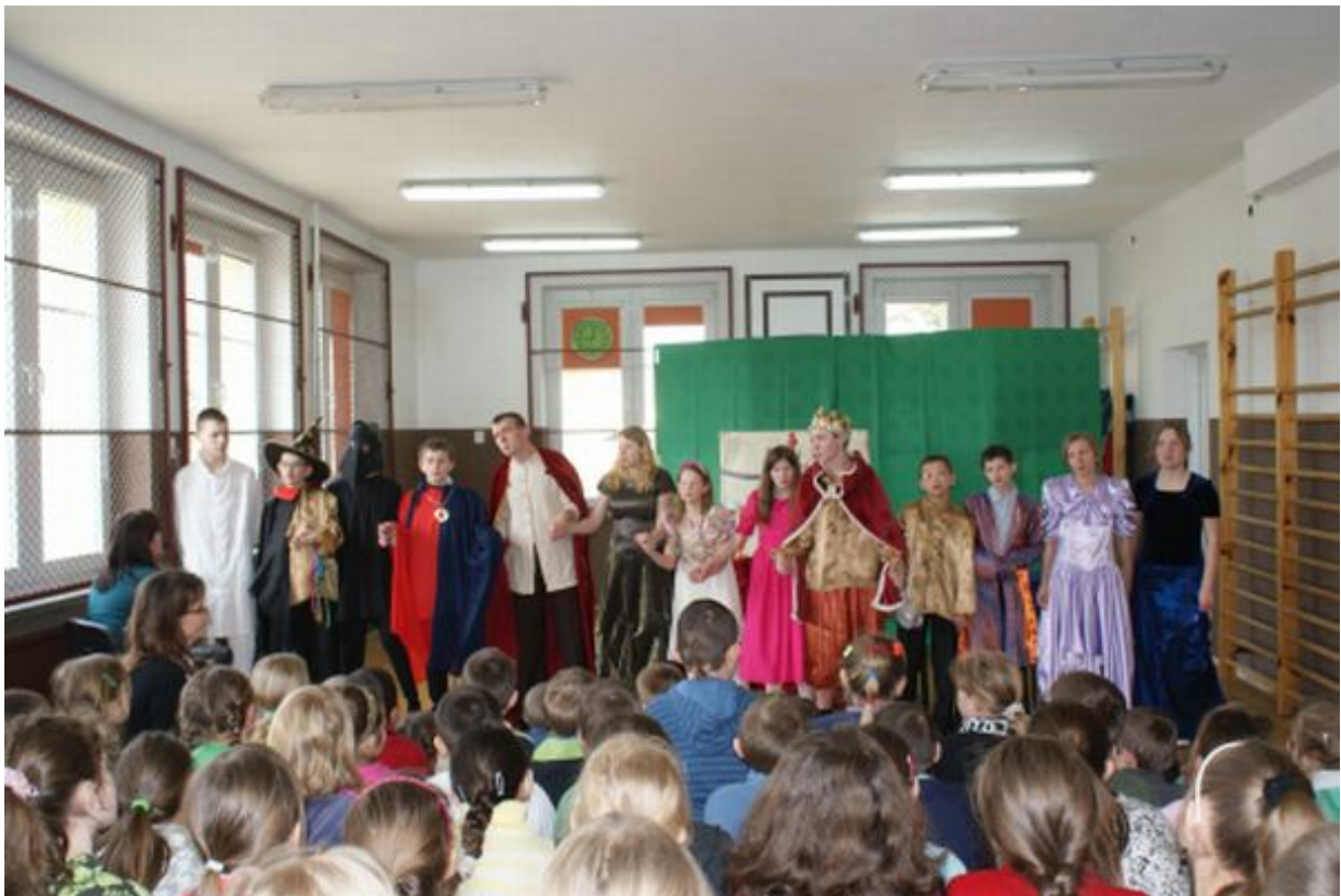
Wszystko, co dobre, szybko się kończy