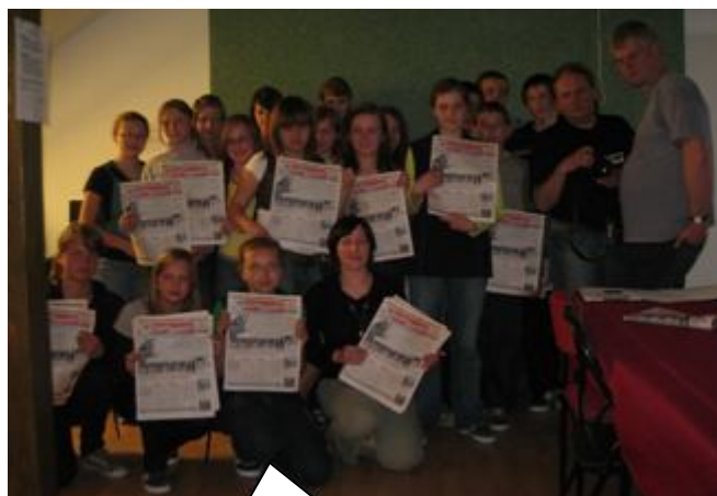
Młodzi dziennikarze wraz z opiekunką