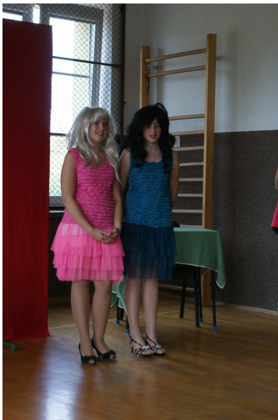
Kto to taki ?