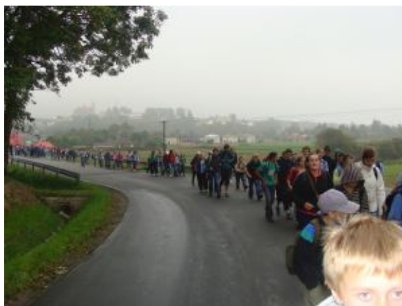
Wytrwale do celu