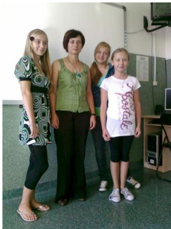
Opiekun SU, Przewodnicząca i Zastępcy