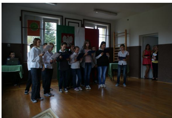
Klasa I gimnazjum