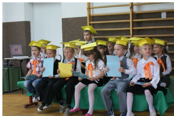
Uczniowie klasy I SP

Po złożeniu przysięgi wszyscy odetchnęli z ulgą i zostali przyjęci do braci uczniowskiej.