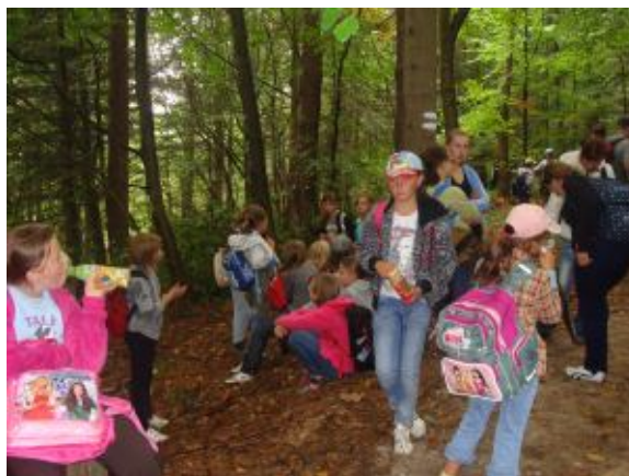
Czas na odpoczynek