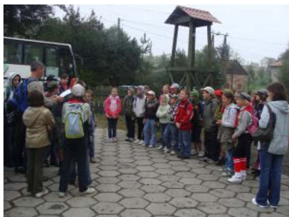
Tuż przed wyjściem...