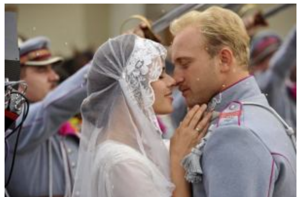
Fotos z filmu