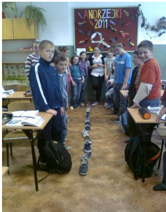
Klasa VI SP

tematycznie związane ze świętem gazetki, inni zorganizowali na godzinach wychowawczych wraz z wychowawcami wróżby. Cieszyły się one dużym zainteresowaniem, dostarczyły wiele radości i zabawy.