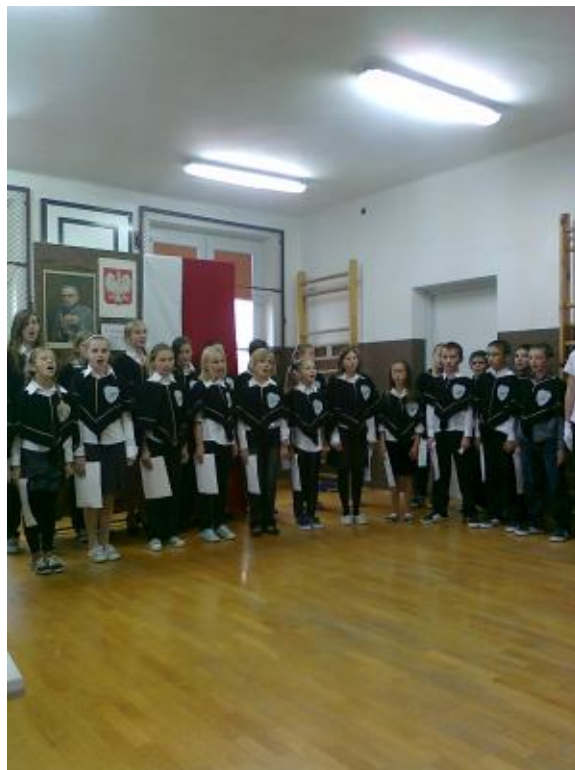
Nasz szkolny chór