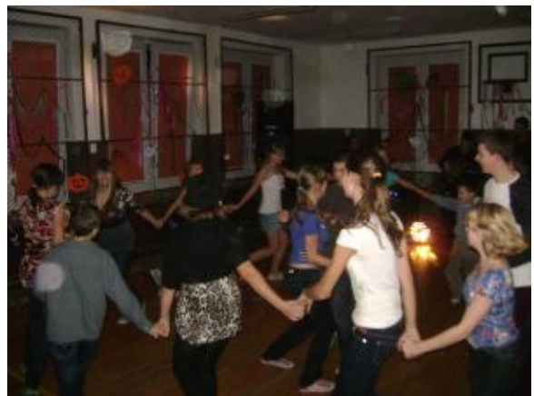
Tańcom nie było końca...

26 listopada 2011 uczniowie naszej szkoły bawili się na ZABAWIE ANDRZEJKOWEJ do tańca przygrywał zespół ALTON. Były też tradycyjnie wróżby (każdy poznał swoją przyszłość), konkursy, dużo śmiechu i taniec nawet towarzyski. Wszyscy dobrze się bawili. Wbrew pozorom nikomu nie przeszkadzał fakt, że to sobota, wręcz odwrotnie. Nawet do światła na sali można było się przyzwyczaić. Młodzi kole-dzy też nie byli przeszkodą, ale partnerami do tańca.