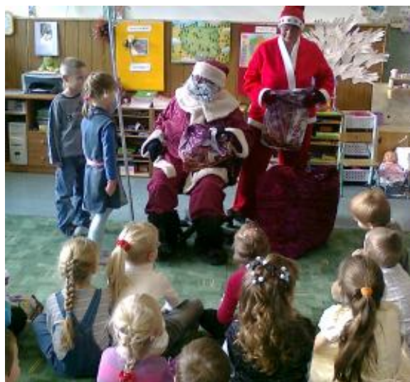
Święty Mikołaj w przedszkolu