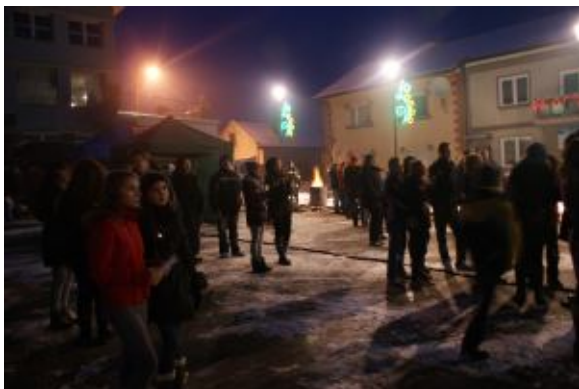
Tłumy na placu Floriańskim