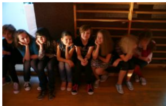
Chwila na odpoczynek