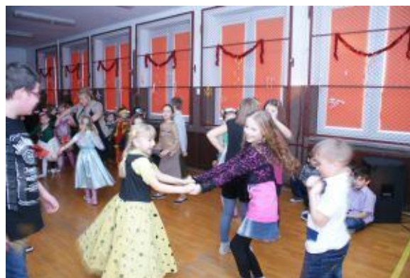
Mój jest ten kawałek podłogi...