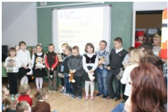
Występy naszych uczniów