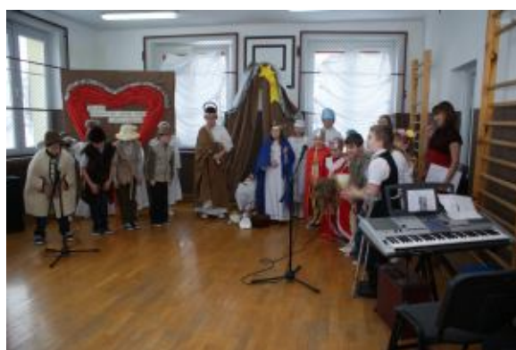
Jasełka, czyli rodem prosto z Betlejem