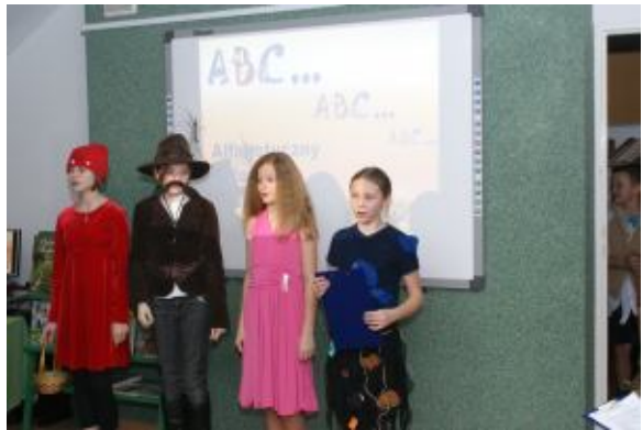
Czytanie dobrych książek jest niczym rozmowa z najwspanialszymi ludźmi minionych czasów