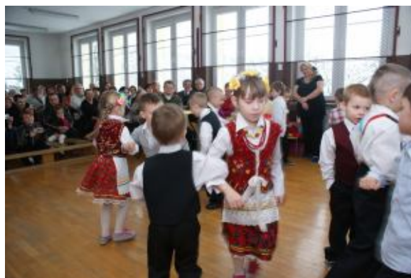
Nasze przedszkolaki w tańcach ludowych