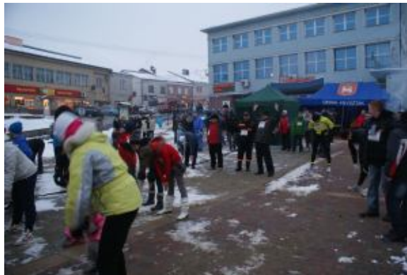
Rozgrzewka przed wielkim biegiem ulicznym