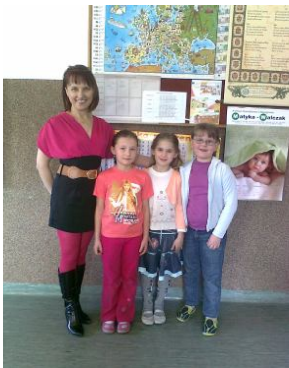
Uśmiechnięte i szczęśliwe... Kl. II SP