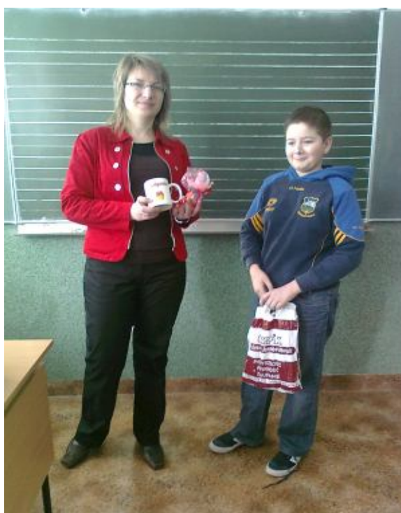
Naszej Drogiej Pani...