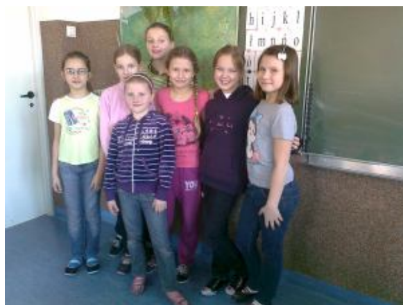
Nasze „Kobietki” z kl. III SP