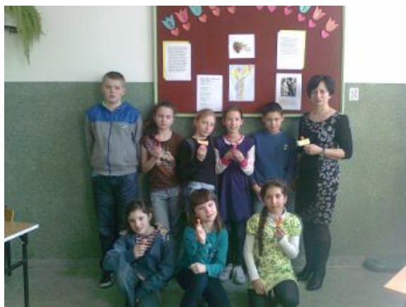
Dzień Kobiet w kl. IV SP

Z okazji Dnia Kobiet pragnę złożyć Ci życzenia, wszystkiego najlepszego, dużo szczęścia, by w każdym dniu roku uśmiech na twarzy Twej gościł tak samo często, jak w tym dniu. Bądź zawsze szczęśliwa, złym losom nieznana, uprzejma, czuła, tkliwa, przez wszystkich kochana.