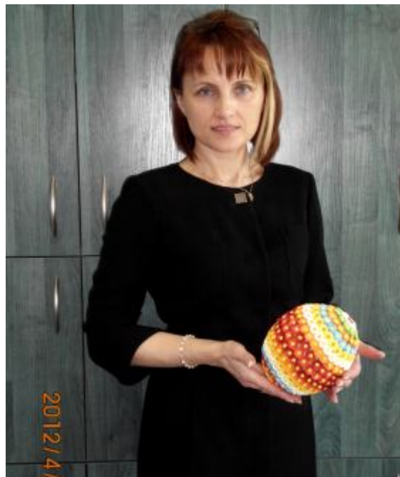
Pisanka wykonana przez P. Anastazję

„obiadem bez dymu”. Tego dnia nie wypada gotować. Wyjątkiem jest odgrzanie tłustego żuru z białą kiełbasą. Dzieci otrzymują po śniadaniu słodczyce tzw. „zajaczki” - lukrowane ciastka, czekoladowe zające.