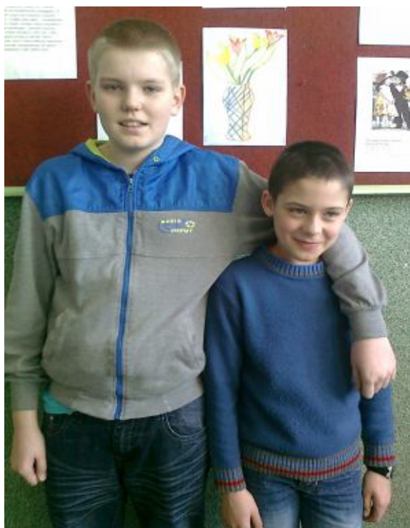
Dwóch nieustraszonych z kl. IV SP, złożyli życzenia i wręczyli upominki.