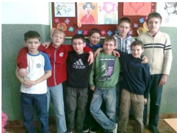
Mężczyźni z kl. VI SP

Dużo szczęścia i radości, przede wszystkim też miłości. Byś kochana zawsze była, w samotności już nie żyła. Zdrowia także życzę Wam i serdecznie pozdrawiam.