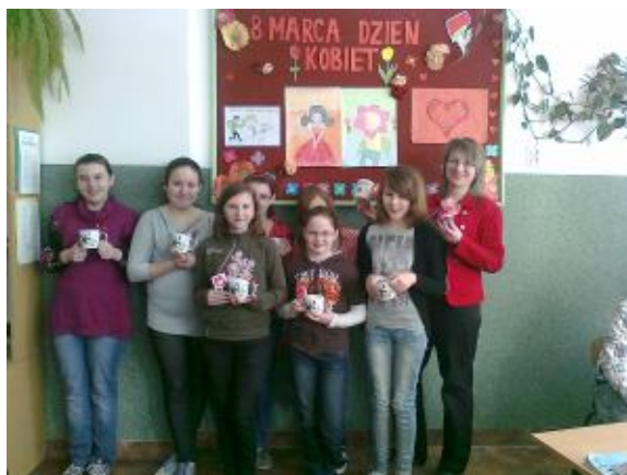
Docenione przez klasowych mężczyzn Kobiety z kl. VI SP

Z okazji Dnia Kobiet, życzę Ci dużo zdrowia w szczególności. Niech uśmiech na Twojej twarzy zawsze gości, a życie nie sprawia trudności. Niech wiatr pieśń niesie Ci radosną, abyś zawsze czuła się jak wiosna. Wśród pachnących kwiatów i śpiewających ptaków. Aby motyle na dłoni Ci siadały i najskrytsze marzenia spełniały. Aby ptaki po niebie latały i Twojego szczęścia szukały. Żeby z Twoich oczu leciały tylko radosne łzy, tak jak wiosną pachnące bzy. W trudnych chwilach niech gwiazdy nad Tobą czuwają i właściwą drogę wybrać pozwalają. One nie pozwolą nigdy Ci zginąć i żadnego szczęścia ominąć.