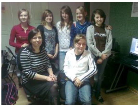
Kobiety z kółka dziennikarskiego