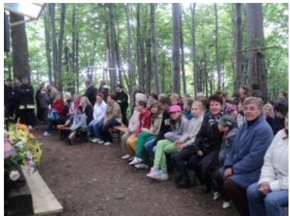
Na Górze Chełm