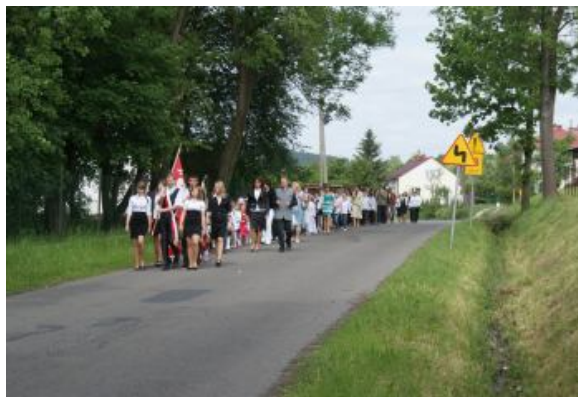
Przemarsz do kościoła