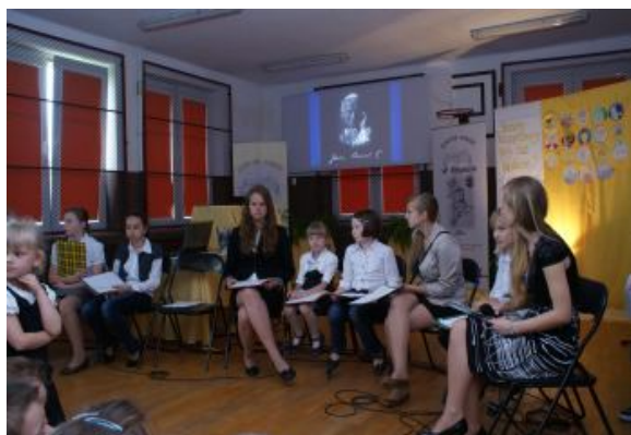
Uczniowie prowadzący część artystyczną