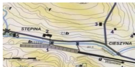
Jak dojechać do Stępiny?