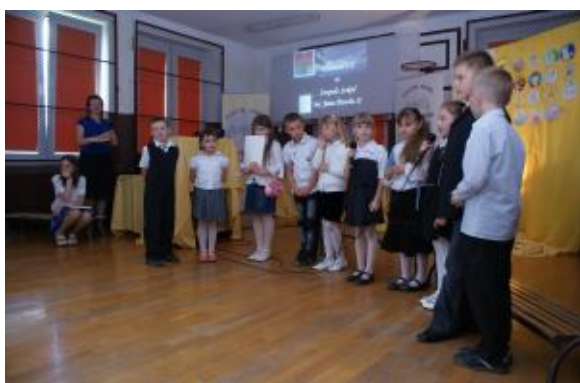
Nasi młodsi koledzy i koleżanki