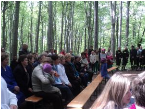
A las przyjaźnie szumiał...