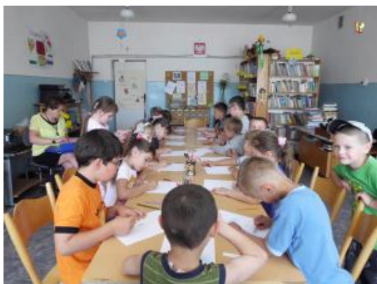
W Bibliotece Publicznej