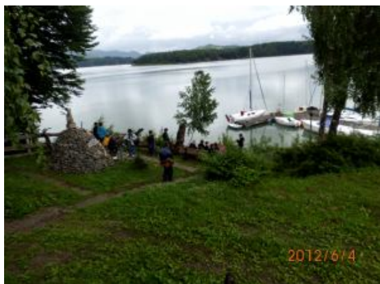
Odpoczynek przed odpłynięciem