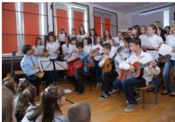
Szkolny zespół instrumentalny