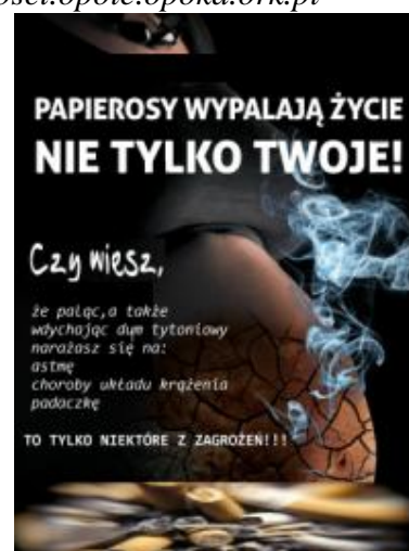
Ulotkę wykonała Andżelika Papuga – ucz. kl. II g.