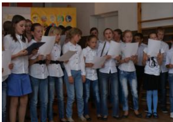
Rozśpiewały się obłoki...