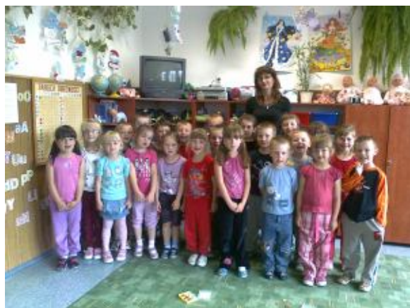
Z naszą kochaną Panią