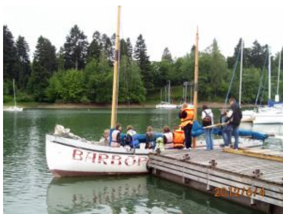
Pierwsze wejście na pokład