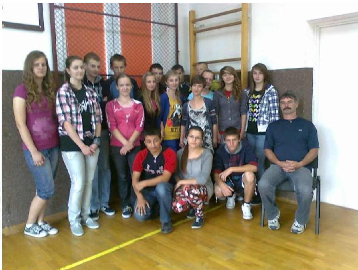
Absolwenci klasy III wraz z wychowawcą