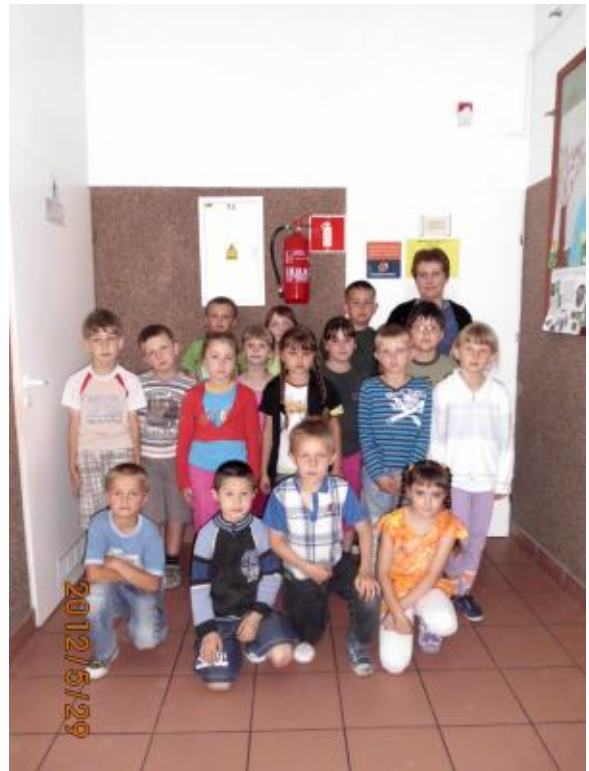
Klasa I SP wraz z wychowawcą