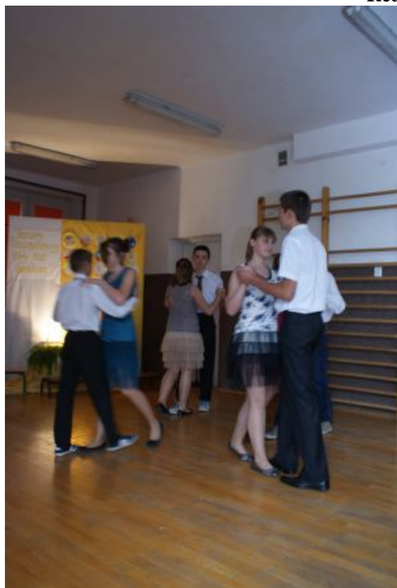
„Prawdziwego mężczyznę właśnie po tym poznać, jak tańczy tango”