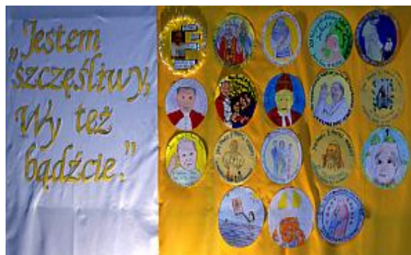
Prace konkursowe wszystkich uczestników