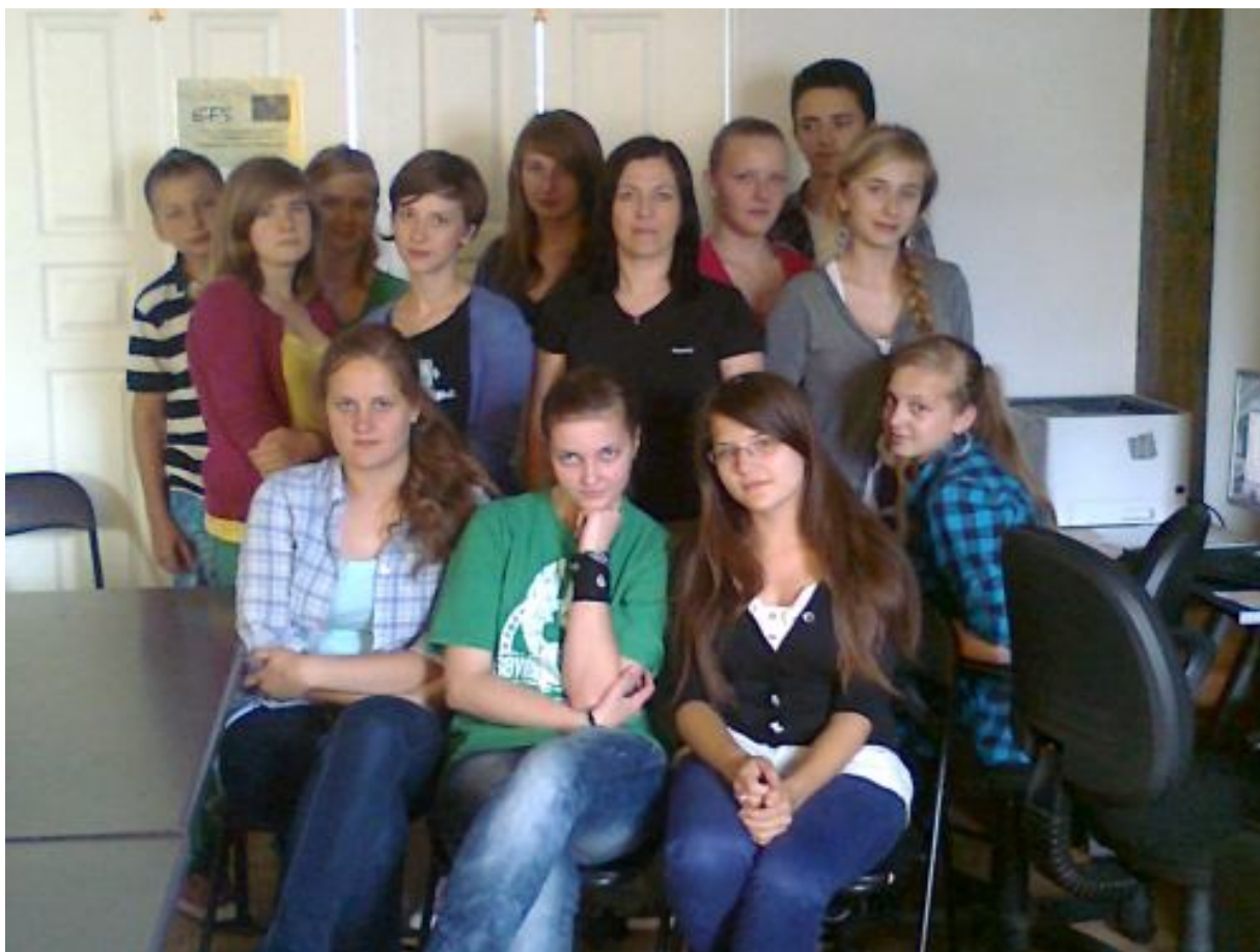
Redakcja gazetki „Tu i teraz - bis”