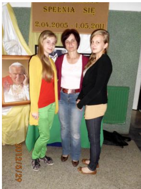
Opiekunka SU wraz z przewodniczącą szkoły i jej zastępcą.