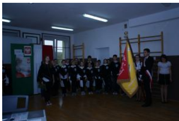
Baczność! Do hymnu państwowego!