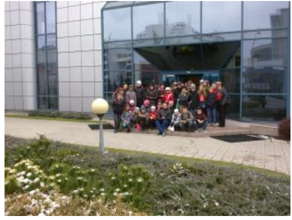
Przed budynkiem TVP Rzeszów