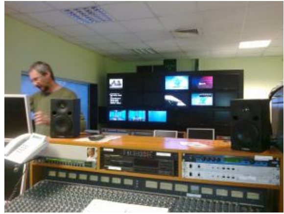
W studio akustycznym