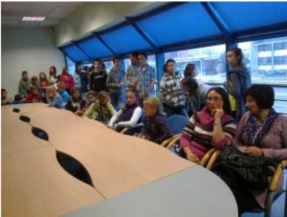
W sali obrad