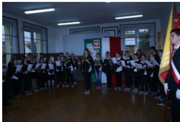
Występ szkolnego chóru

http://www.jastrzebiezdroj.zhp.pl/wordpress/?p=366