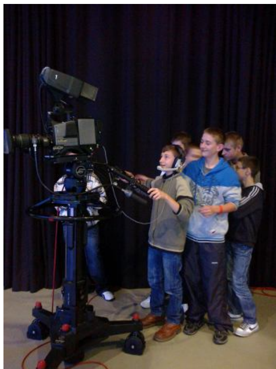
Duże zainteresowanie wzbudzała wśród chłopców kamera. Kto wie, może w przyszłości nasi koledzy będą pracownikami TVP Rzeszów ?