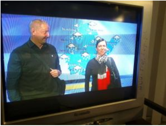
Jaka będzie pogoda ? ☺