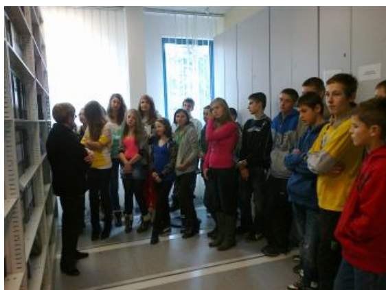
W archiwum TVP Rzeszów. Znajduje się w nim unikatowy materiał z pielgrzymki Jana Pawła II do Rzeszowa.