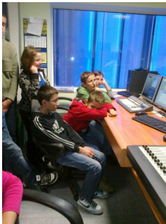
W tym pomieszczeniu pracują osoby odpowiedzialne za dźwięk i obraz.