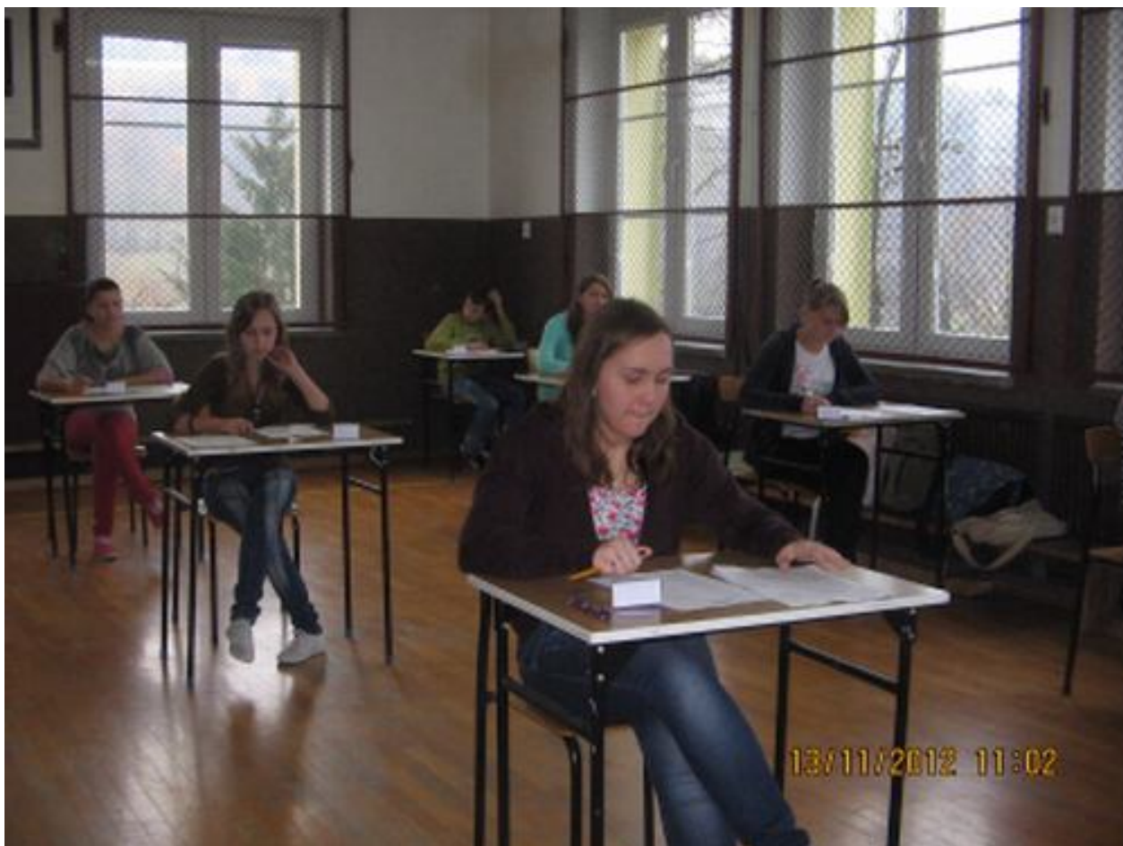
W trakcie pisania...