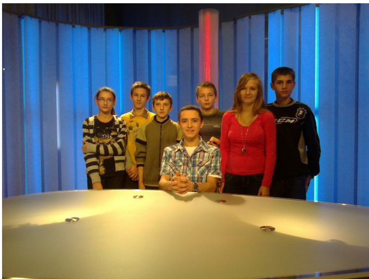
Zespół redakcji gazetki „Tu i teraz – bis”