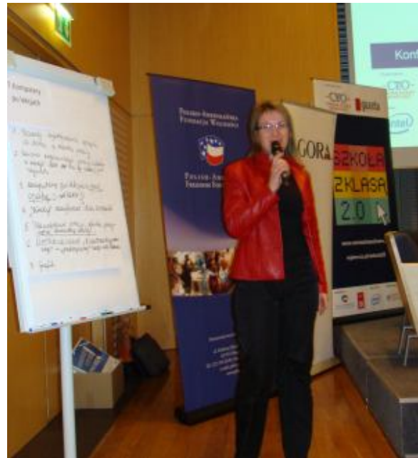
Głos zabrała także pani Małgosia