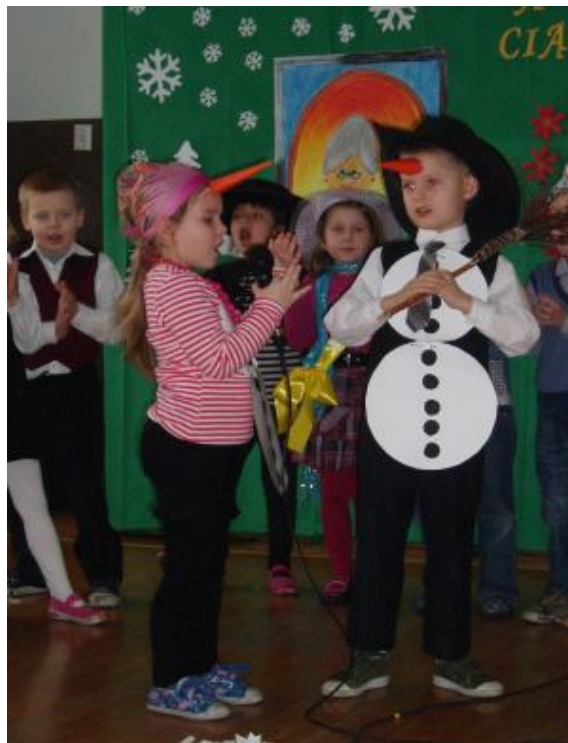
Nasi najmłodsi „aktorzy”