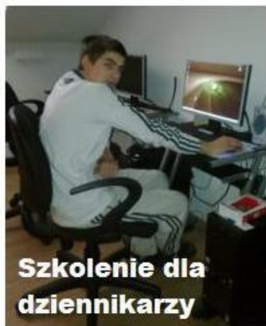
Szkolenie dla dziennikarzy