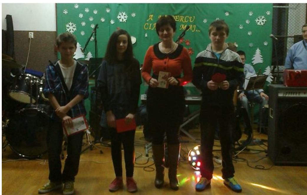
Zdobywcy największej ilości „walentynek”