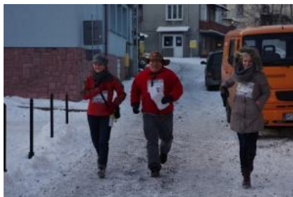
Dyrektor podczas biegu