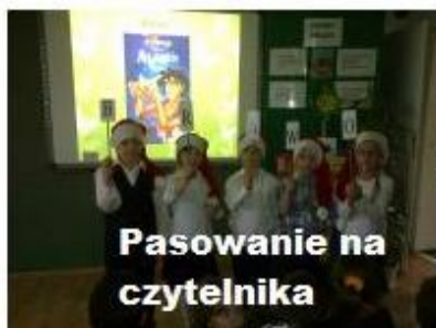
Pasowanie na czytelnika