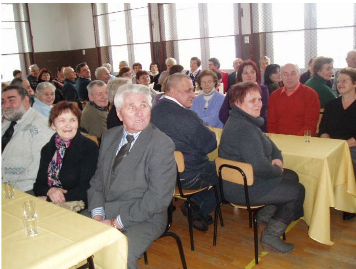
Licznie zgromadzeni Seniorzy