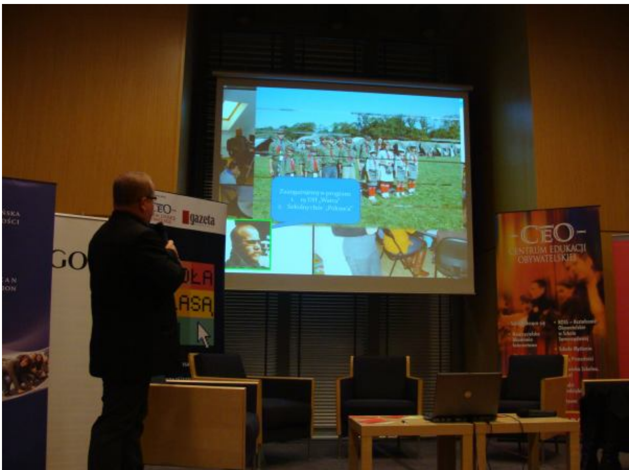
W sali konferencyjnej Gazety Wyborczej dyrektor opowiadał o naszej szkole