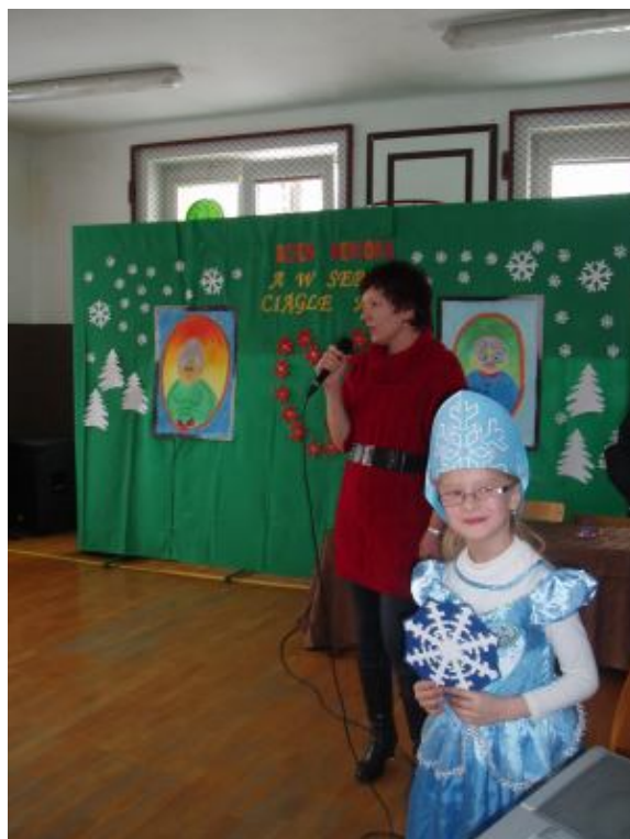
Przewodnicząca Rady Rodziców