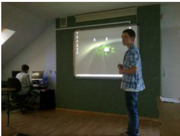
Wykorzystanie tablicy interaktywnej