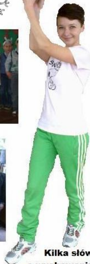
Kilka słów o wychowaniu fizycznym