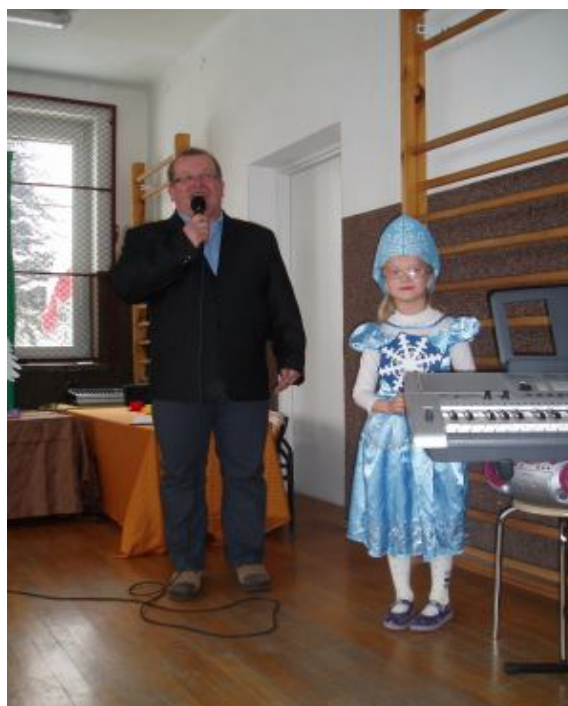
Powitanie zebranych przez dyrektora ZS