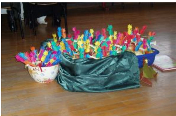
Upominki dla naszych seniorów

http://chomikuj.pl/avalon63/Galeria+PRZEJ*c5*9aCIOWA/*e2*9e*b8+21-22+stycze*c5*84-Dzie*c5*84+Babci+i+Dziadka