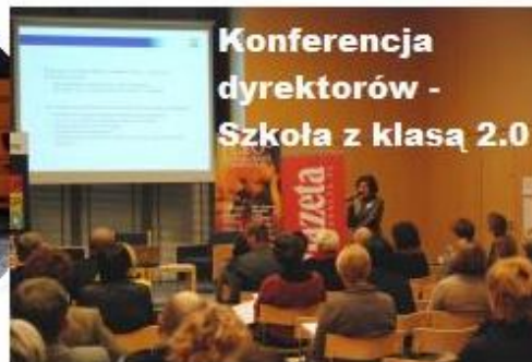
Konferencja dyrektorów - Szkoła z klasą 2.0