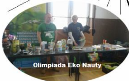
Olimpiada Eko Nauty