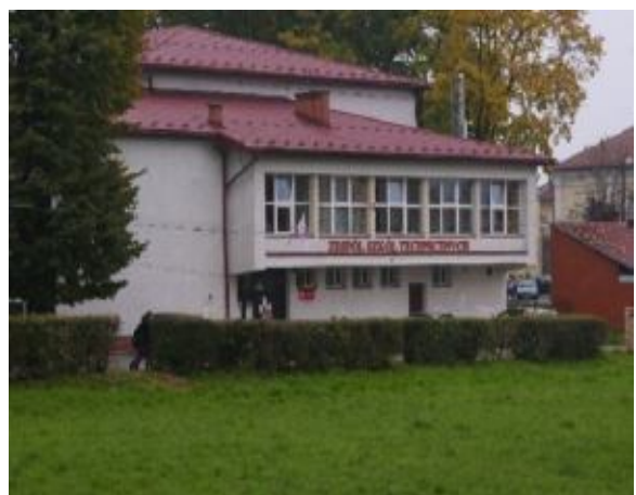
ZST w Strzyżowie