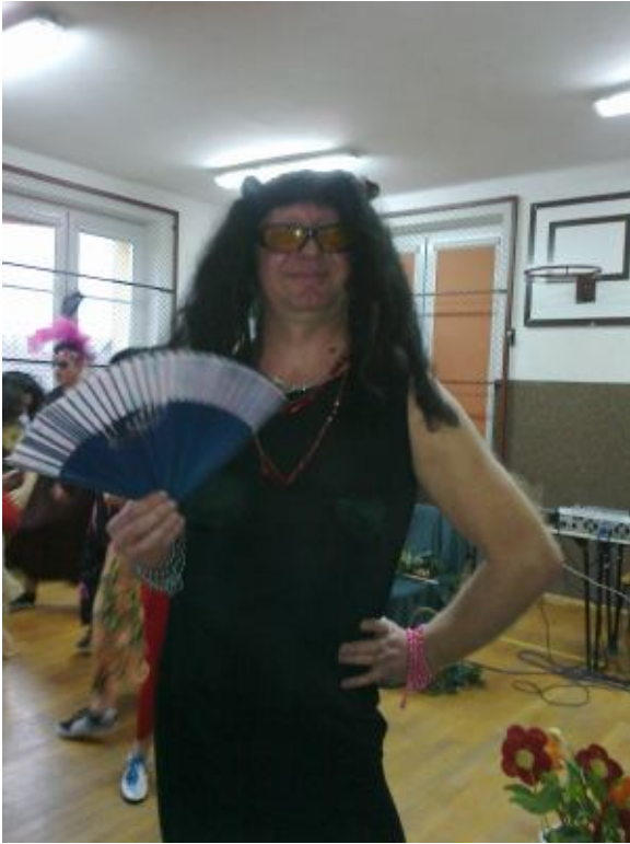
CZARNA MAMBA ☺☺☺