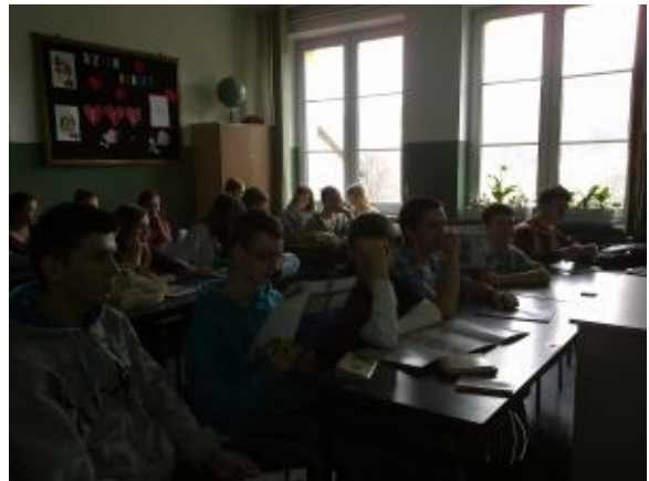
Klasa III G