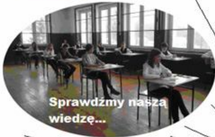
Sprawdźmy naszą wiedzę...

Od 2009 r. wydajemy w naszej szkole Gazetkę Młodych Dziennikarzy. Właśnie wydaliśmy 20. – jubileuszowy numer, z czego jesteśmy bardzo dumni. Gonimy za informacją, poszukujemy nowych tematów i rejestrujemy ważne wydarzenia z życia społeczności szkolnej. Kontynuujemy dzieło naszych poprzedników, tj. redaktorów gazetki „Magazynek Nowinek” (19 DH „Watra”) i dwumiesięcznika „Tu i teraz”.