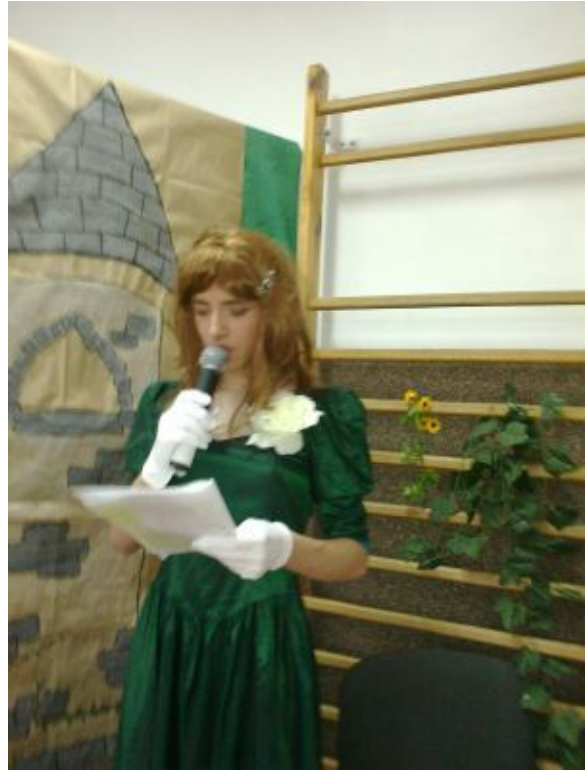
Dawno, dawno temu...