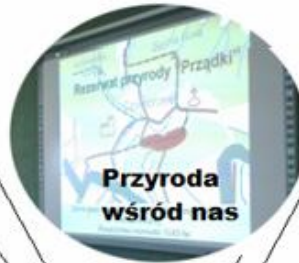
Przyroda wśród nas