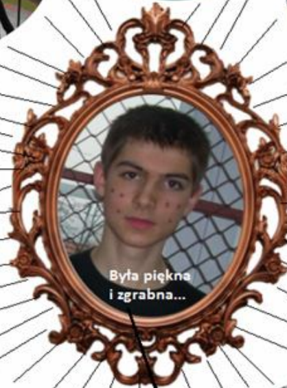
Była piękna i zgrabna...