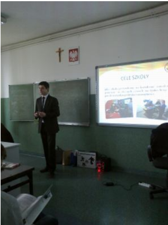
Przedstawiciel ZST ze Strzyżowa