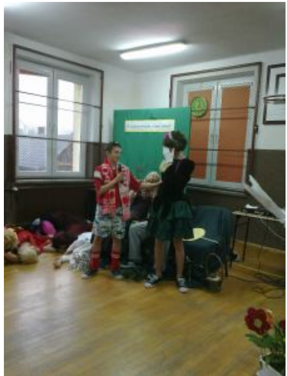
Książę i księżniczka Roszponka