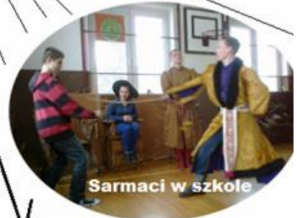
Sarmaci w szkole