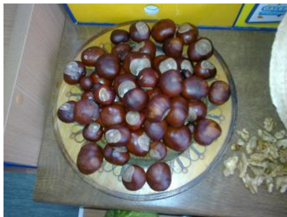
Dary jesieni ...