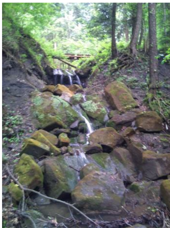
Piękno naszego krajobrazu