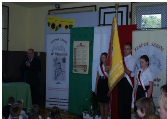
Głos zabrał Pan Dyrektor