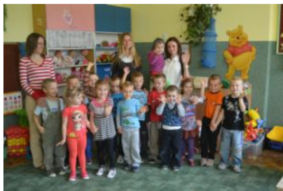
Najmłodszy uczniowie w naszej szkole