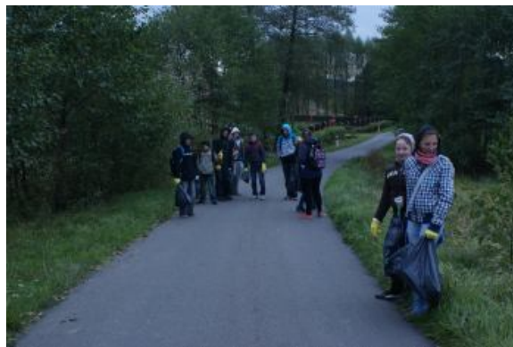
Czysto, pięknie i przyjemnie