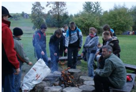
Wspólnie przy ognisku