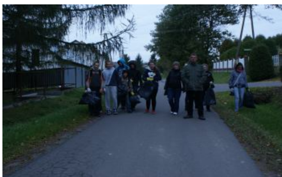
Czystość świata w naszych rękach