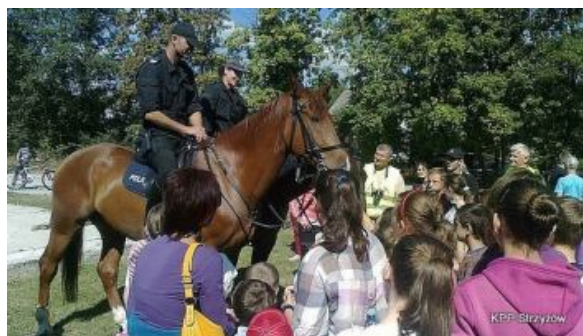
Patrol konny z Rzeszowa