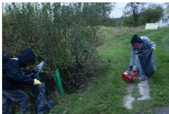
Butelka po oleju...