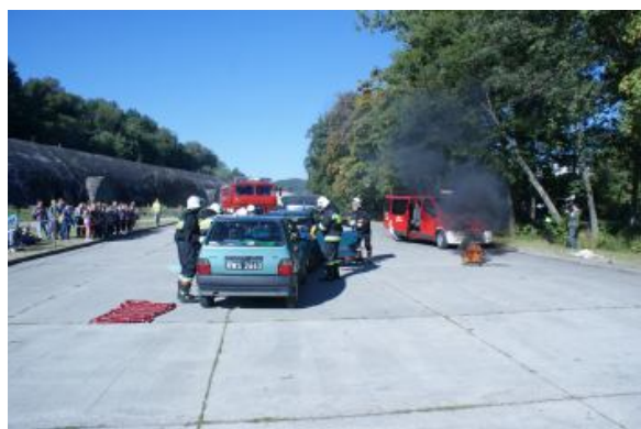
Pokazy straży pożarnej Zdarzenie drogowo Przeciąganie kurtyny wodnej