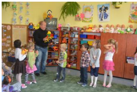
Pasowanie starszaków przez pana dyrektora