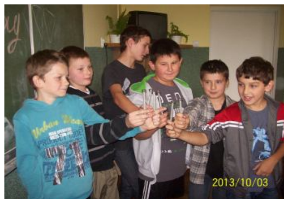
Chłopcy z klasy V

Skoro dzisiaj świętujemy, To się uczyć nie będziemy, Więc naukę zostawiamy I życzenia Wam składamy.