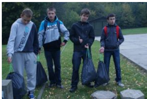
Chłopcy z grupy pierwszej