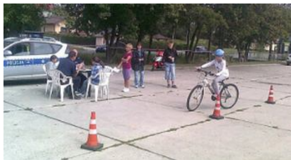
Egzamin na kartę rowerową

http://www.presseurop.eu/pl/content/article/1078281-tydzien-w-piekle