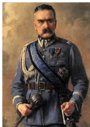
Naczelnik Państwa Polskiego - Józef Piłsudski