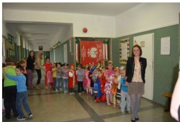
Jedzie pociąg z daleka...