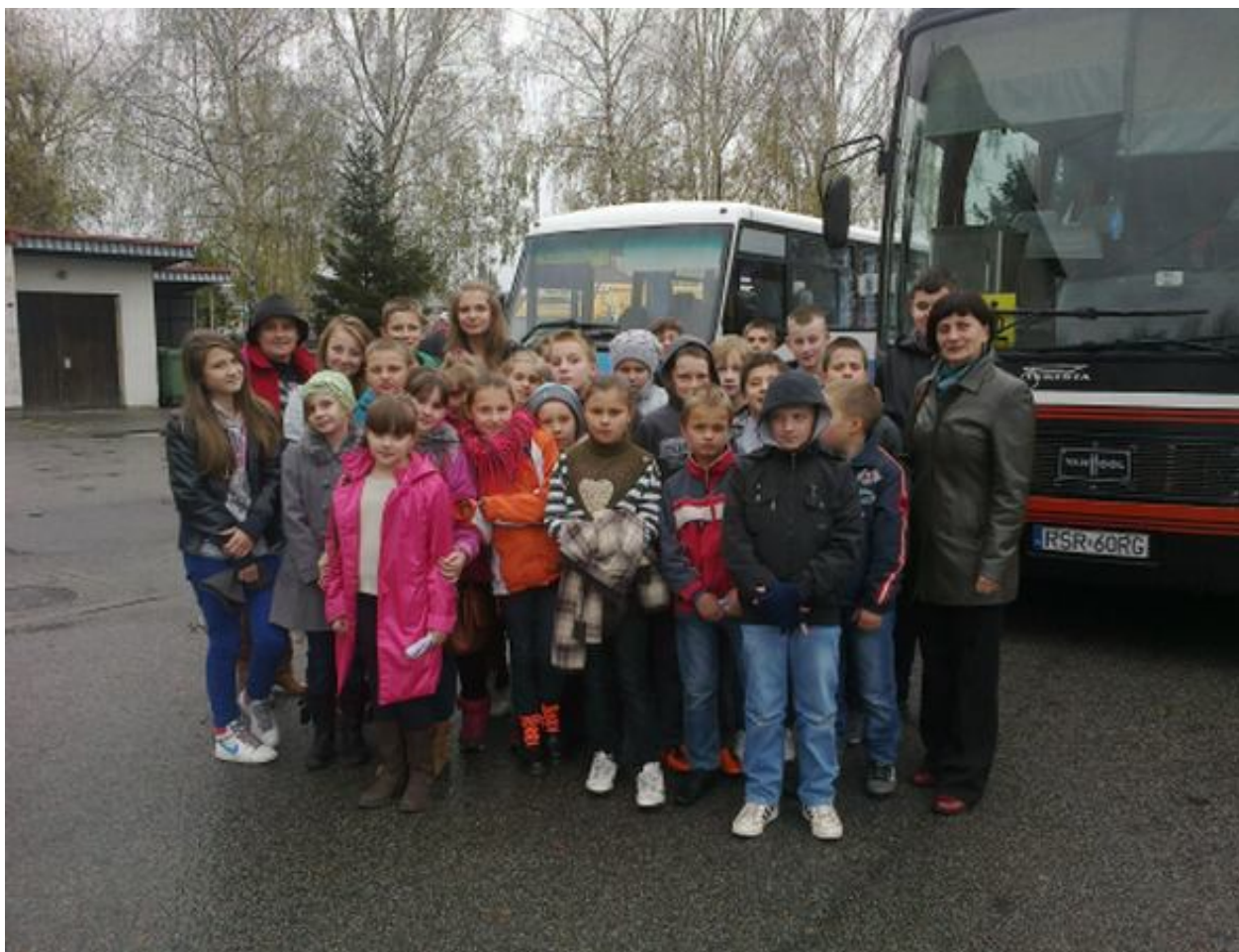
Uczestnicy wyjazdu do Domu Kultury „Sokół”