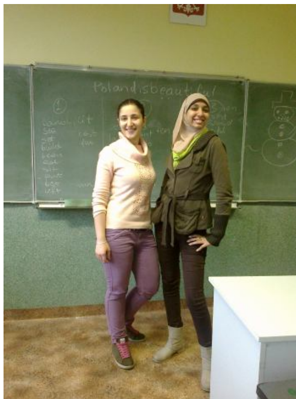
Uśmiechnięte i szczęśliwe

M: W języku arabskim „Shokran” znaczy „dziękuję”, więc na pożegnanie chciałam powiedzieć „Shokran Polsko!”.