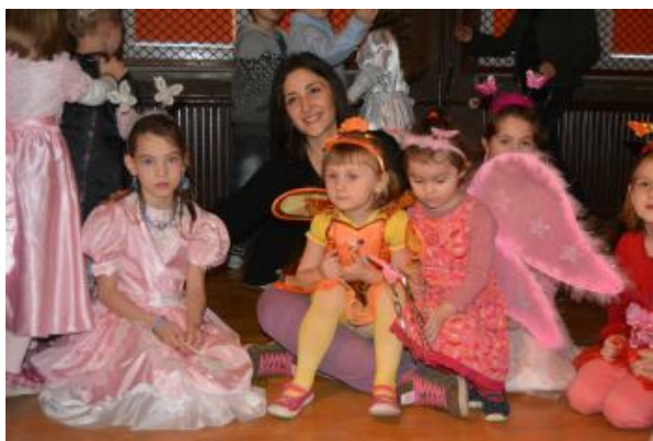
Razem z Sali