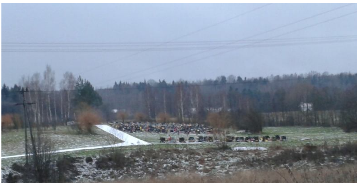
Widok na cmentarz w Stępinie