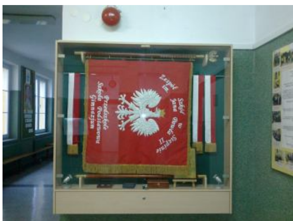
Sztandar naszej szkoły