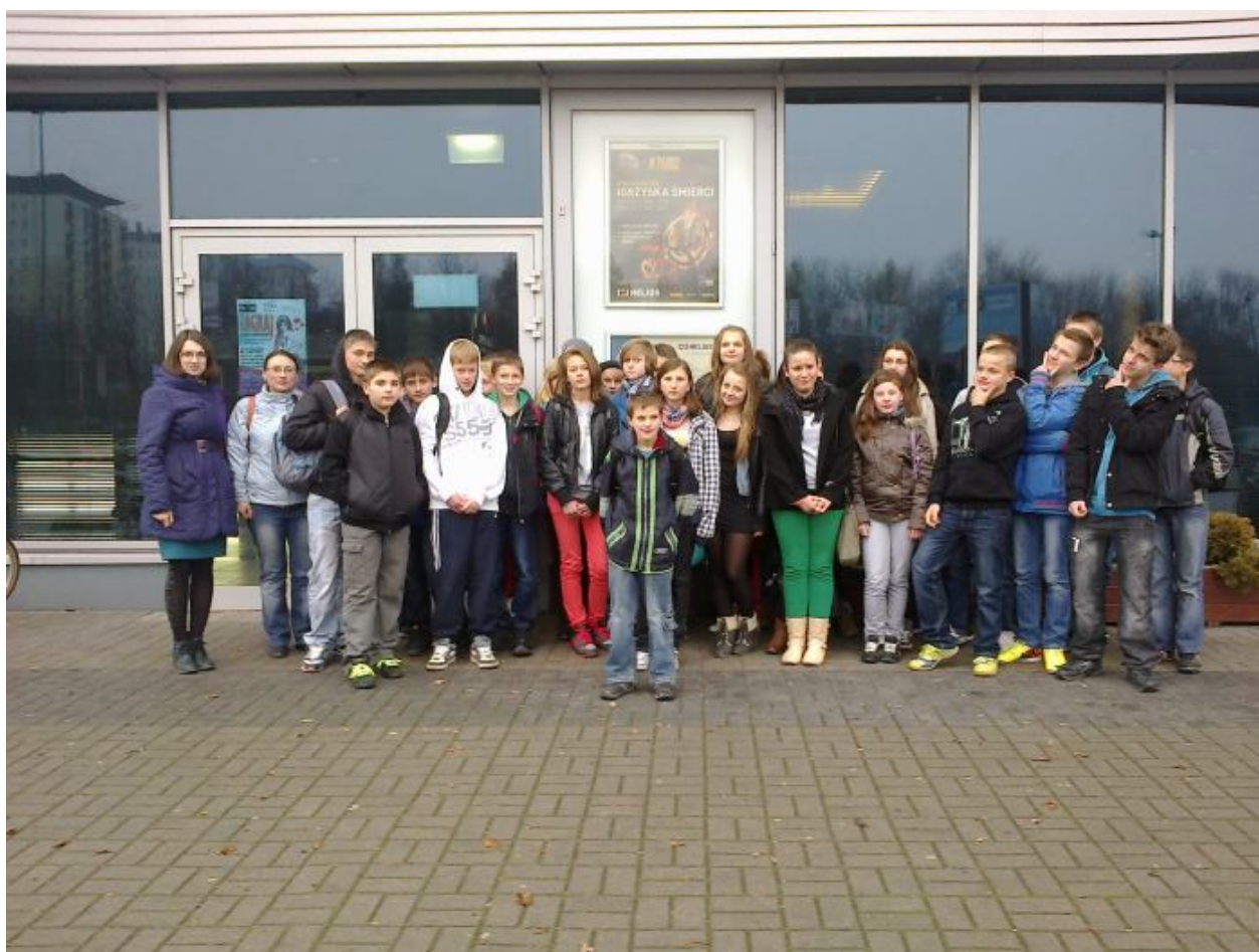
Gimnazjaliści w kinie Helios