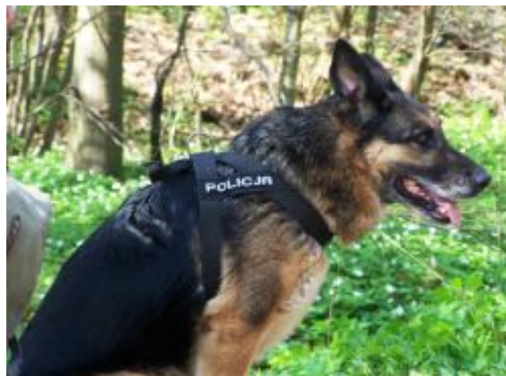
Pies pracujący w policji

Mój pies Chucky jest mieszańcem Cocker Spaniela oraz kundla. Jest posłuszny i mądry. Lubię z nim chodzić na spacerów oraz bawić się z nim. Ogólnie bardzo lubię zwierzęta, można się z nimi zaprzyjaźnić.