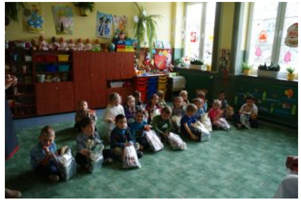
Zadowolone i uśmiechnięte przedszkolaki