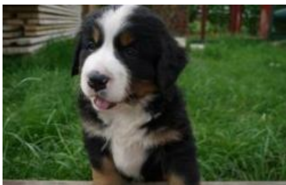
Berneński pies pasterski

Pies to udomowiona forma wilka szarego. Psy żyją przeciętnie 13-14 lat. Wiek psa określa się po oględzinach stanu uzębienia oraz ilości siwych włosów na głowie. Najstarszym psem w historii według Księgi rekordów Guinnessa był Bluey, który przeżył 29 lat, 5 miesięcy i 7 dni. Najważniejszym zmysłem dla psa jest węch. Zaczyna się nim posługiwać już jako ślepe szczenię. Psy poddane odpowiednim szkoleniom wspomagają służby mundurowe w tropieniu i rozpoznawaniu przestępców na podstawie śladów zapachowych. Psy mają znacznie czulszy słuch niż człowiek i mogą słyszeć dźwięki o częstotliwości lub tonacji dla człowieka niesłyszalnej, a zasięg słuchu jest znacznie większy w porównaniu ze słuchem człowieka. Większa czułość słuchu może powodować, że dźwięki o silnym natężeniu będą wywoływały u niego ból.