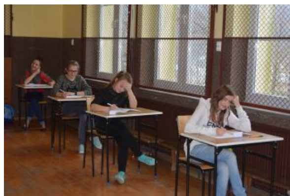
To już kolejny test..., tym razem z matematyki