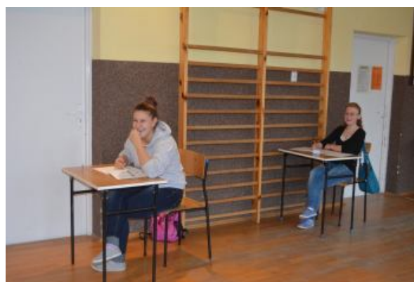
Dzisiaj przy pierwszym stoliku