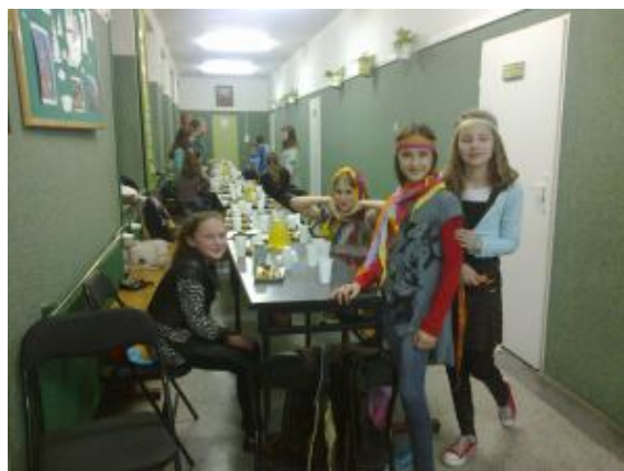
Wspólnie przy stole ☺