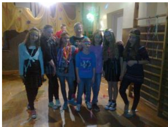
Dziewczyny z klasy V ☺