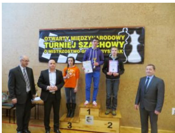
Najlepsi zawodnicy z gminy Frysztak