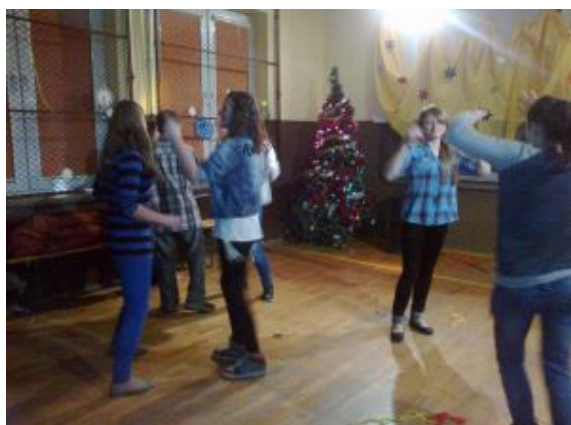
Dance, dance, dance ...