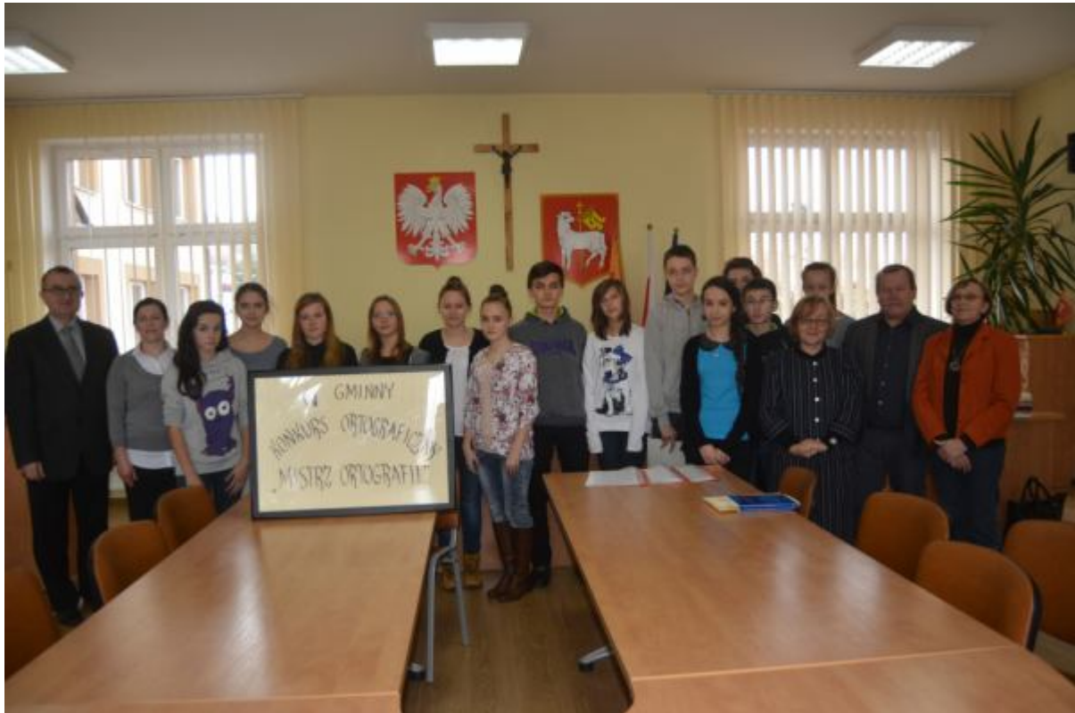
Wszyscy uczestnicy konkursu