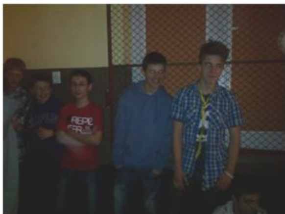
Chłopaki się jeszcze nie rozkręcili...