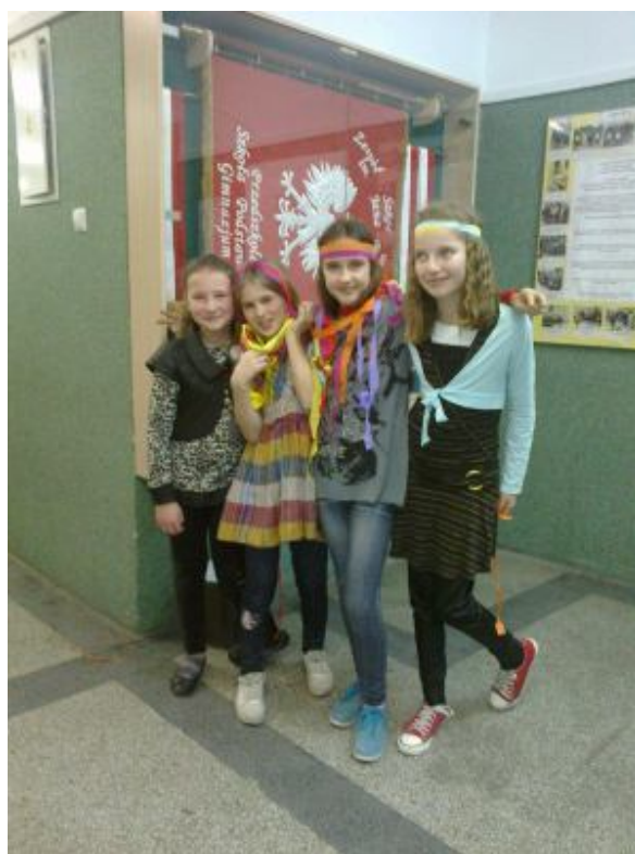
Uśmiechnięte i szczęśliwe ...