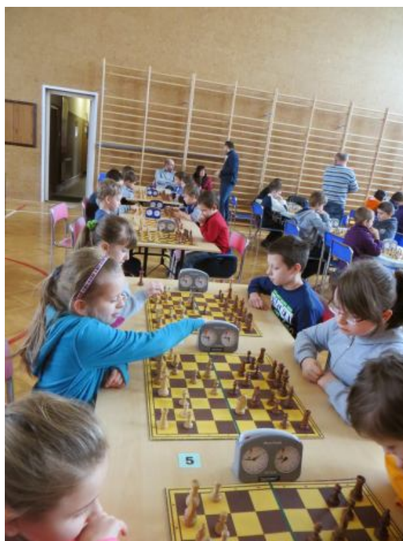
Zawodnicy z grupy C