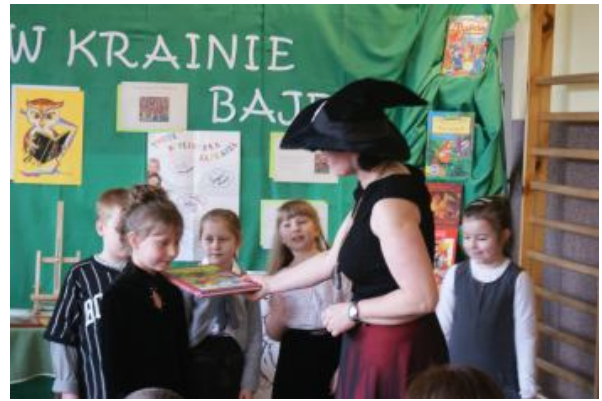
Pasuję Cię na czytelnika...