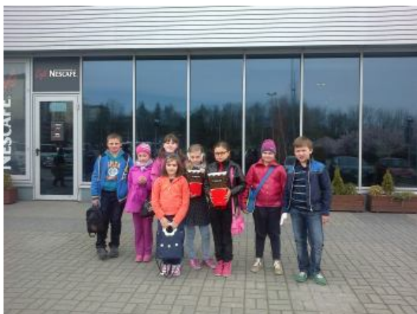
Przed kinem Helios