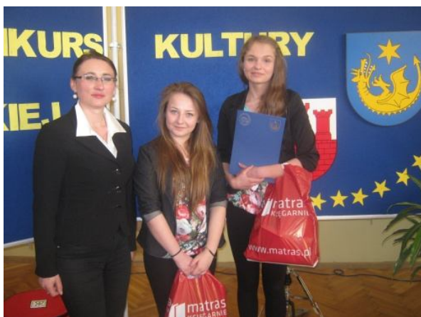
Z uśmiechem na twarzy ... ☺