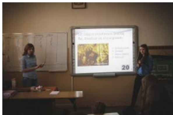
Wykorzystanie tablicy interaktywnej