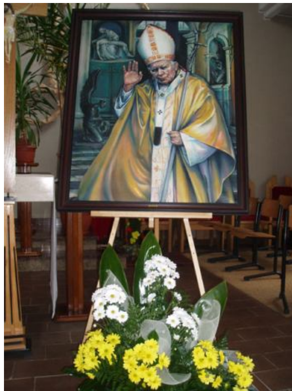
Wizerunek Jana Pawła II w kościele parafialnym w Stępinie