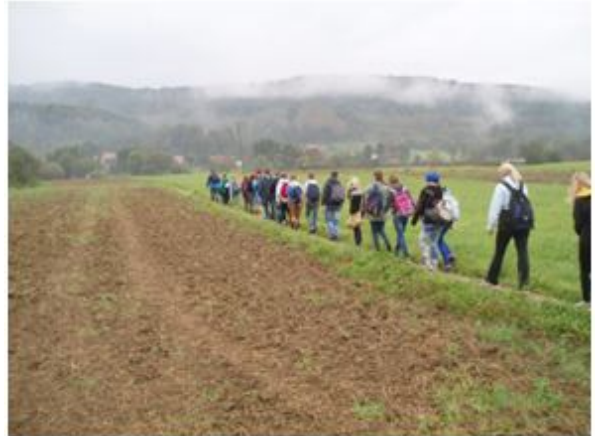
W strugach deszczu...