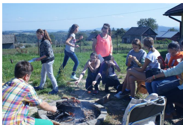
Pieczenie kielbaski w Centrum Edukacji Ekologicznej