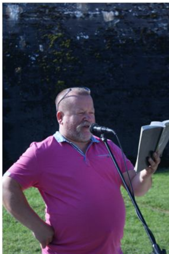
Pan Dyrektor w roli Zagłoby z „Trylogii”