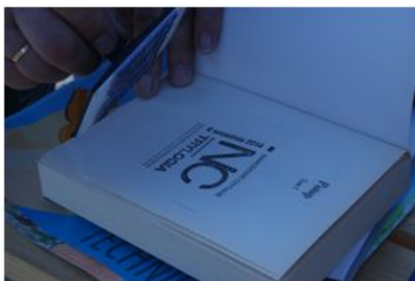
Ostemplowane książki pieczęcią z Biura Kultury i Dziedzictwa Prezydenta Rzeczypospolitej Polskiej