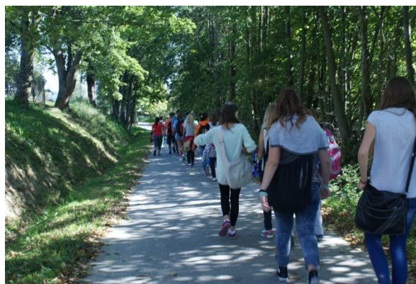
W drodze powrotnej