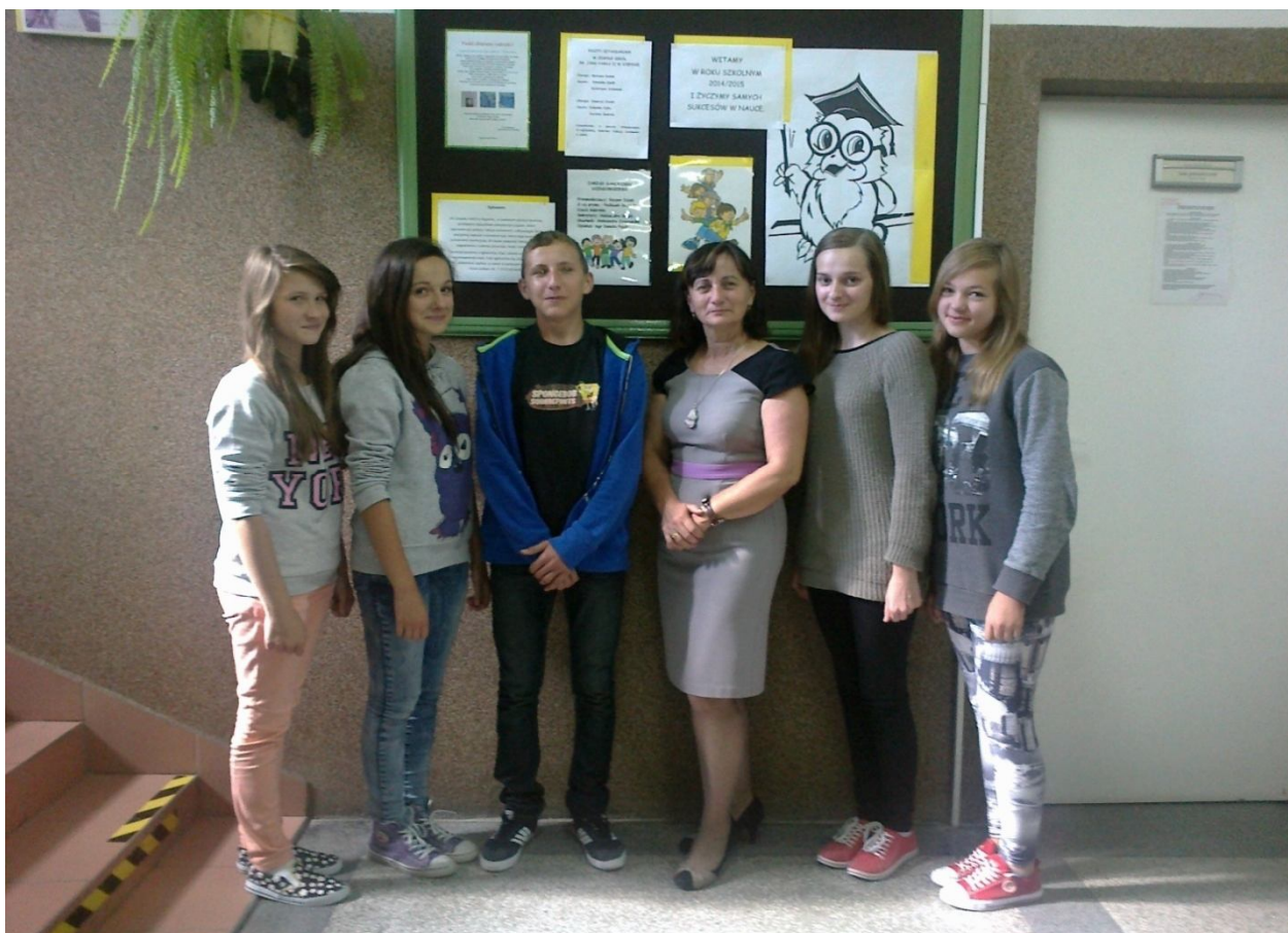
Aktualny skład Samorządu Uczniowskiego