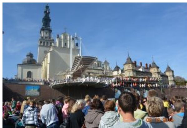
Tłumy młodzieży z całej Polski Na Błoniach Częstochowskich. Wśród nich przedstawiciele naszego Zespołu Szkół im. Jana Pawła II w Stępinie