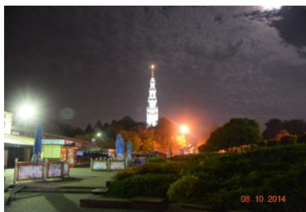
Klasztor na Jasnej Górze o zachodzie słońca