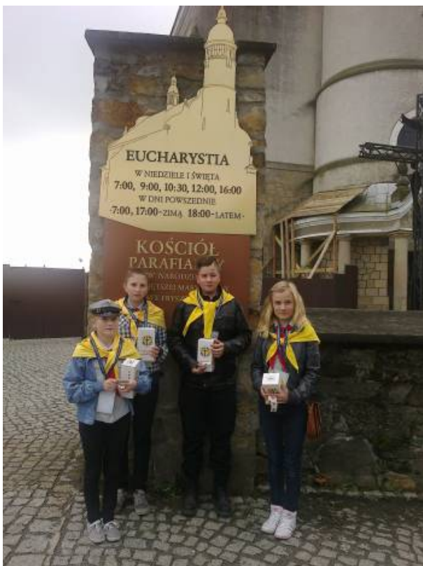
Podczas kwesty we Frysztaku