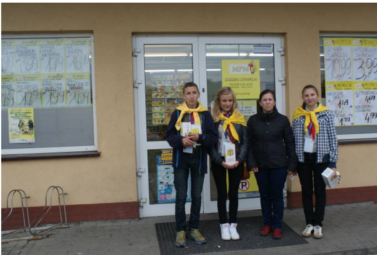
Pod Centrum Handlowym MPM w Lubli.

Kwestujący harcerze spotkali się z życzliwością i ofiarnością wielu ludzi, za co serdecznie dziękujemy.