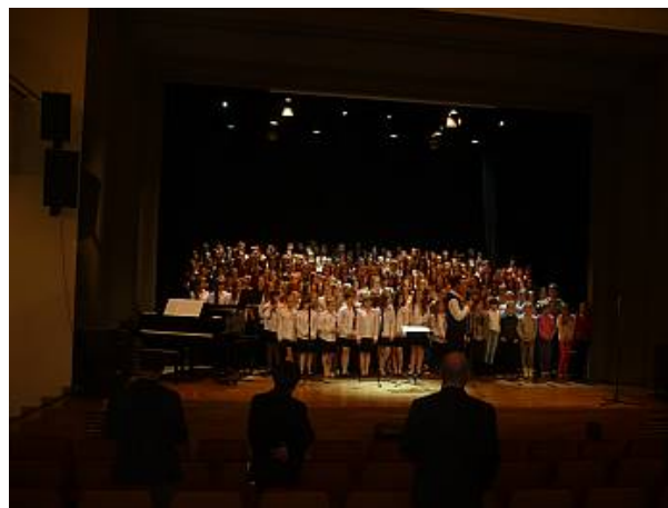
Wspólne wykonanie finałowej pieśni „Marsz Polonia”