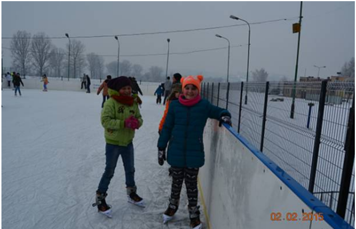
Na lodowisku ☺