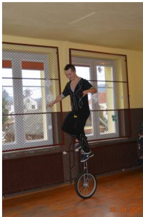
Akrobacje na monocyklu