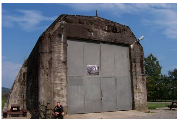
Schron kolejowy w Stępinie z okresu II wojny światowej.

Ostatnia i najdłuższa trasa jest trasa obejmująca tereny Frysztaka, Pułanek, Cieszyny, Stępiny, Huty Gogołowskiej, Gogołowa, Glinika Górnego i Glinika Dolnego. Na trasie tej możemy zaobserwować cmentarz we Frysztaku, Bramę Frysztacką, schron kolejowy w Stępinie, następnie drogę biegnącą przez Kamieniec. Rozciągają się wspaniałe widoki w kierunku Frysztaka i Kleci. Trasa ta, której długość wynosi ok. 22 km jest najbardziej rozciągnięta przez całą gminę Frysztak.