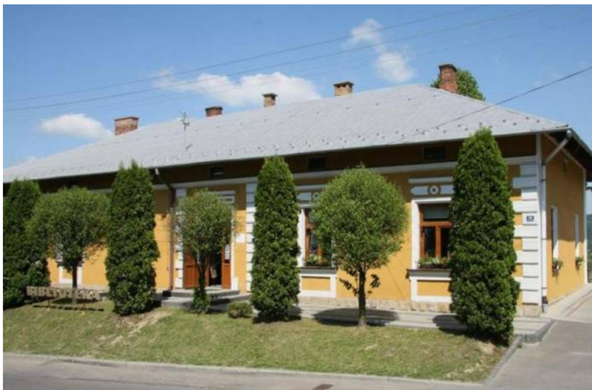
Gminna Biblioteka Publiczna we Frysztaku