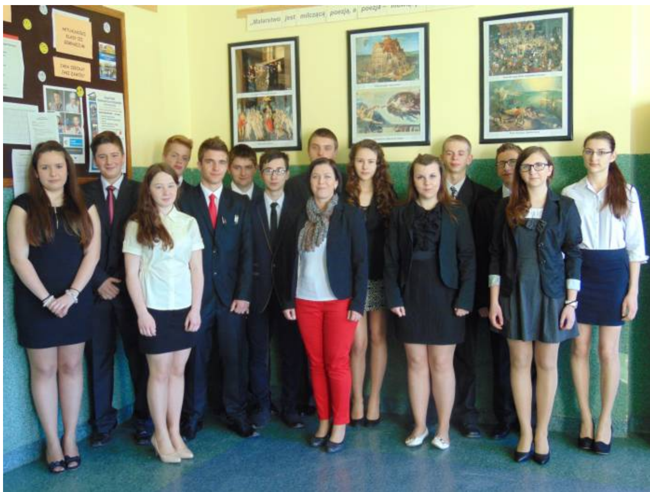
Klasa III gimnazjum wraz z wychowawcą