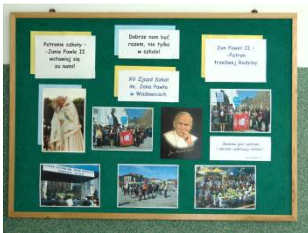
Tematyczna gazetka ścienna Jan Paweł II – Patron trzeźwej Rodziny XV Zjazd Szkół im. Jana Pawła II w Wadowicach