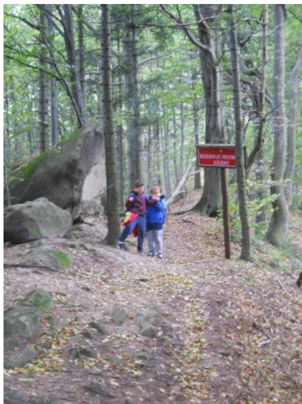
Rezerwat przyrody „Herby”