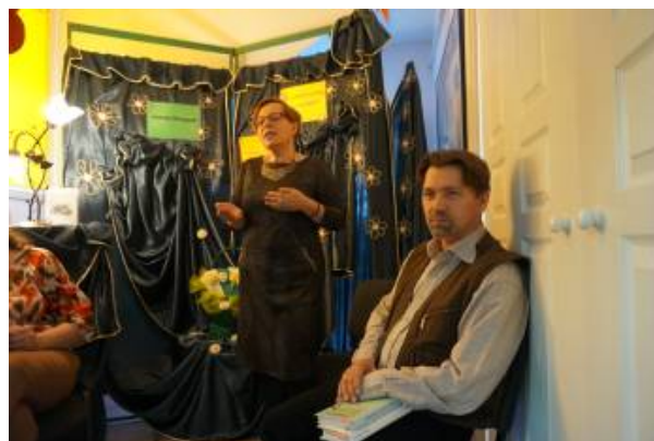
„To – co do ciebie czuję Jest dłonią twarzy słońca (...)”