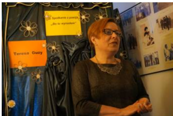
„Wędrowała kropelka rosy Po bezdrożach, wzdłuż szosy. (...)”