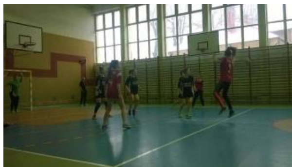
Mecz z dziewczynami z Gogołowa