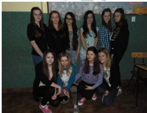
Klasa III gimnazjum