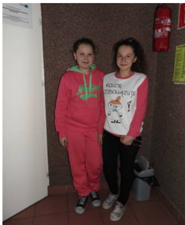
Klasa VI SP