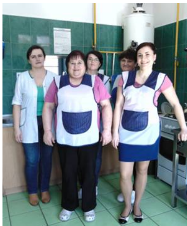
Nasze panie z obsługi