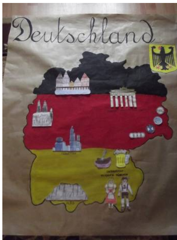
Autor plakatu – Paulina Dziok