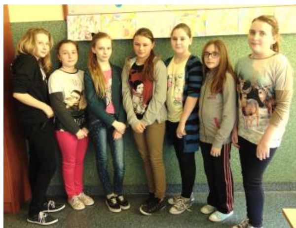
Klasa V SP