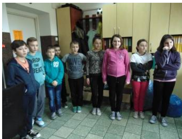
Wszyscy uczestnicy konkursu

Wylosowani uczniowie otrzymali również nagrody pocieszenia.