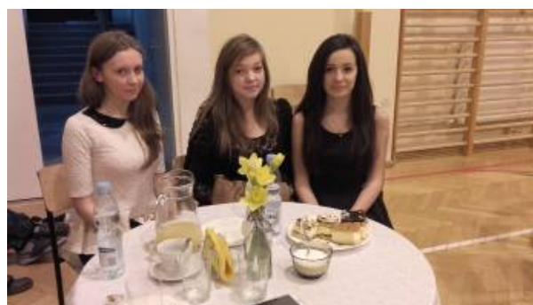
Chwile oczekiwania na prezentację i wyniki przy kawie, herbacie i pysznym ciastku :)