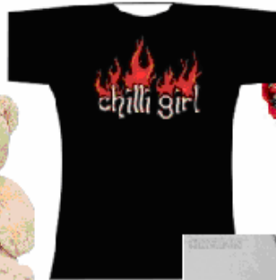
T - shirt