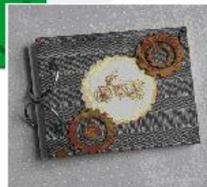
Bolder na płyty CD