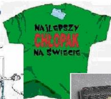
T - shirt